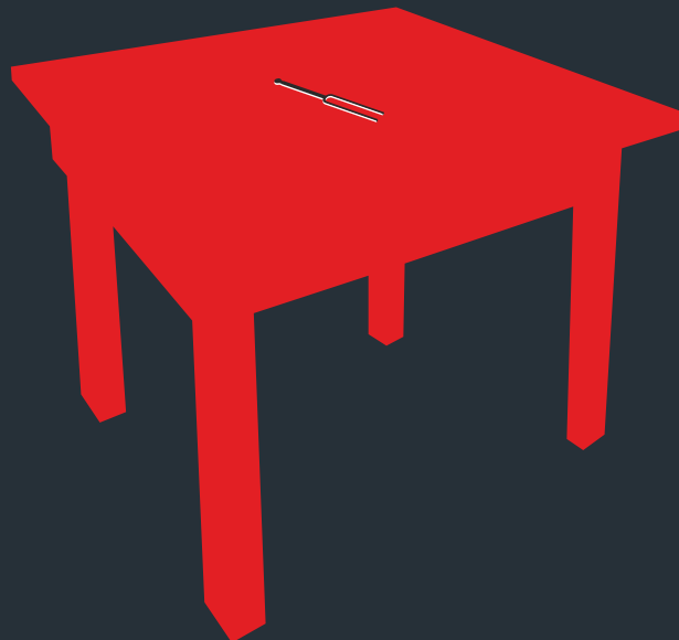
TABLE AROUND CAGE